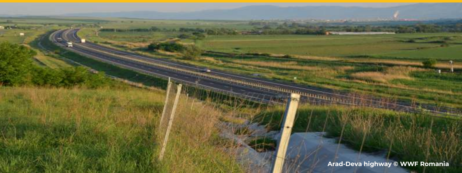
Arad-Deva highway